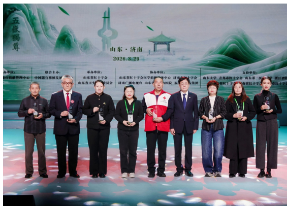
▲全国人大常委会副委员长、中国红十字会会长何维慰问捐献者家属代表并合影

3月28-29日，“生命·曙光——2026全国人体器官捐献缅怀纪念暨宣传普及活动”在山东济南举行。全国人大常委会副委员长、中国红十字会会长何维，中国红十字会党组书记、常务副会长王可，党组成员、副会长兼秘书长李立东，副会长白岩松，山东省常委、组织部部长周立伟，省人民政府副省长、省红十字会会长陈平，国家卫生健康委员会医疗应急司司长高光明，“人民英雄”国家荣誉称号获得者、中国人体器官捐献宣传公益大使张定宇等出席活动。