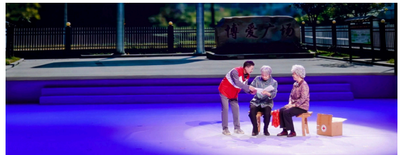
▲情景剧《从一个人的球队到一个村庄的生命观》

此前，在山东省暨济南市遗体捐献纪念广场举行了“生命·曙光”现场缅怀纪念活动，全体人员向捐献者默哀致敬并向纪念碑献花，现场为8位捐献者举行数字礼葬仪式，通过AI数字人技术呈现捐献者自述信，以科技赋能缅怀，让生命记忆永续。