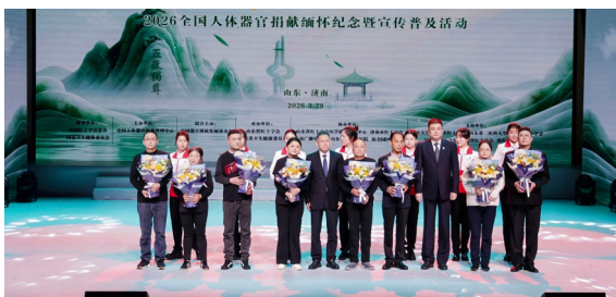
▲慰问移植受者代表