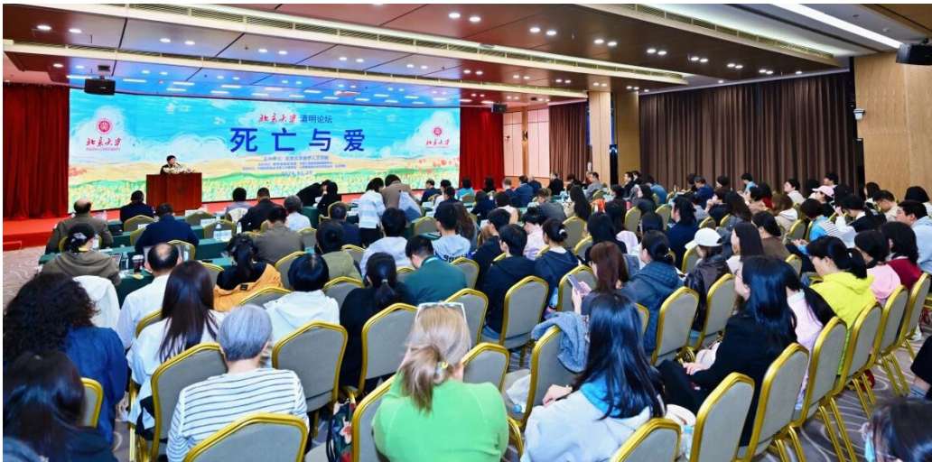
▲第八届北京大学清明论坛现场

3月29日，第八届北京大学清明论坛在北京大学医学部举行。本届论坛的主题是“死亡与爱”，旨在通过对安宁疗护、器官捐献、丧葬礼仪等主题的探讨，传递“生命有限、挚爱无限，医疗有限、大爱无疆”的生死观。论坛由北京大学医学人文学院主办，福寿园国际集团、中国人体器官捐献管理中心协办，中国殡葬协会专家工作委员会、上海福寿园公益发展基金会、礼济学院支持。