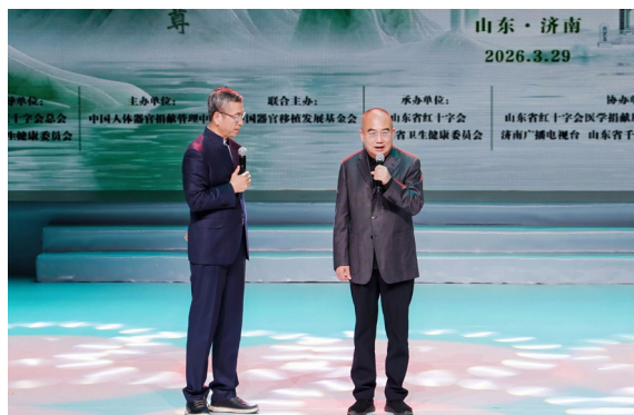
▲白岩松对话“人民英雄”张定宇

活动现场以宣传片、沙画、朗诵、讲述、情景剧、歌舞、音乐剧等多种形式，呈现了器官捐献者及其家人、器官移植受者、器官捐献协调员、红十字工作者和志愿者、医务人员的感人故事和崇高的大爱精神。