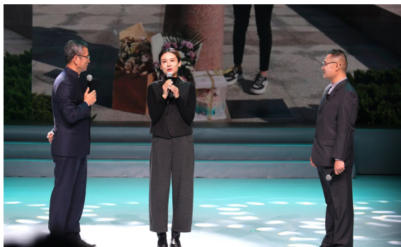
▲捐献者小九月妈妈