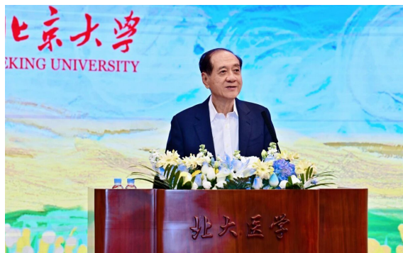
▲第十二届全国政协副主席、中国科学院院士韩启德作主旨发言

相关专业领域师生、从业者代表以及网上报名的公众人士近300人来到论坛主会场，并有约20万网友在线观看论坛直播及相关视频。