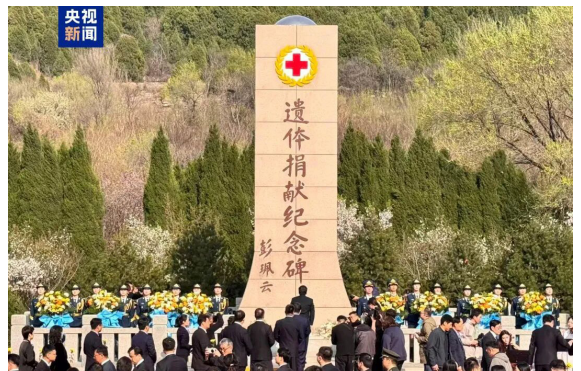
▲室外缅怀纪念活动现场

此前，在山东省暨济南市遗体捐献纪念广场举行了“生命·曙光”现场缅怀纪念活动，全体人员向捐献者默哀致敬并向纪念碑献花，现场为8位捐献者举行数字礼葬仪式，通过AI数字人技术呈现捐献者自述信，以科技赋能缅怀，让生命记忆永续。