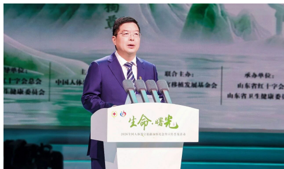
▲山东省人民政府副省长、省红十字会会长陈平致辞