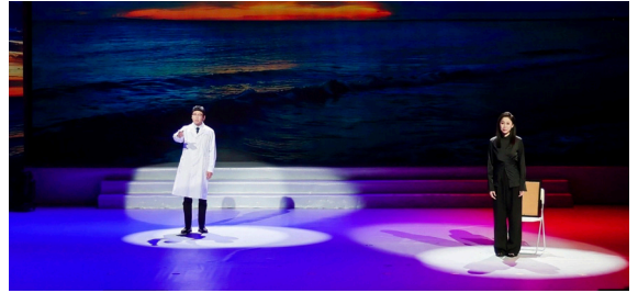
▲时空对话《跨越国界的生命之桥》