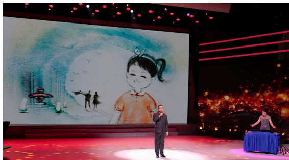
▲真情致敬《天使的馈赠》

活动现场以宣传片、沙画、朗诵、讲述、情景剧、歌舞、音乐剧等多种形式，呈现了器官捐献者及其家人、器官移植受者、器官捐献协调员、红十字工作者和志愿者、医务人员的感人故事和崇高的大爱精神。