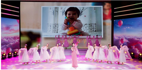
▲歌曲《你是天使来人间》