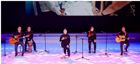
▲“一个人的乐队”演唱《感受生命》