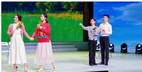
▲音乐剧《我记得·你来过》