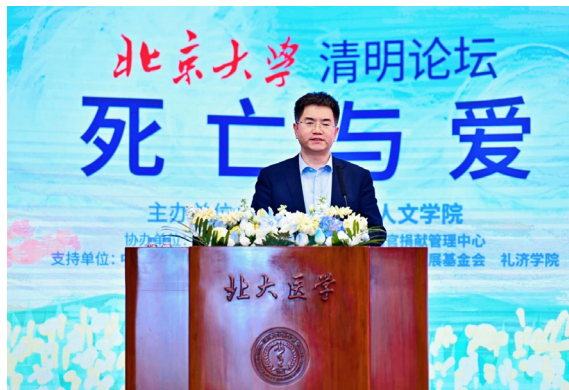
▲中国人体器官捐献管理中心主任侯峰忠 《从星光到曙光，为生命传递美意》

官捐献宣传公益大使”埋下了心灵深处的种子。2018年，张教授被诊断为渐冻症，他也曾有过彷徨和挣扎，但最终选择坦然面对，在2020年新冠疫情暴发时，作为绝症病人的他挺身而出，带领医院全体职工累计救治了2800多名新冠肺炎患者，并在新冠肺炎尸检工作中做出了重要贡献。他将爱进行升华，坚定地书写了自己的人生答卷：死亡可以终结生命，但无法终结爱；死亡可以摧毁肉体，但无法摧毁精神。